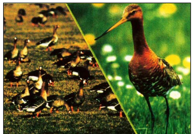
Bleßgans und Uferschnepfe – Zielarten der Planung