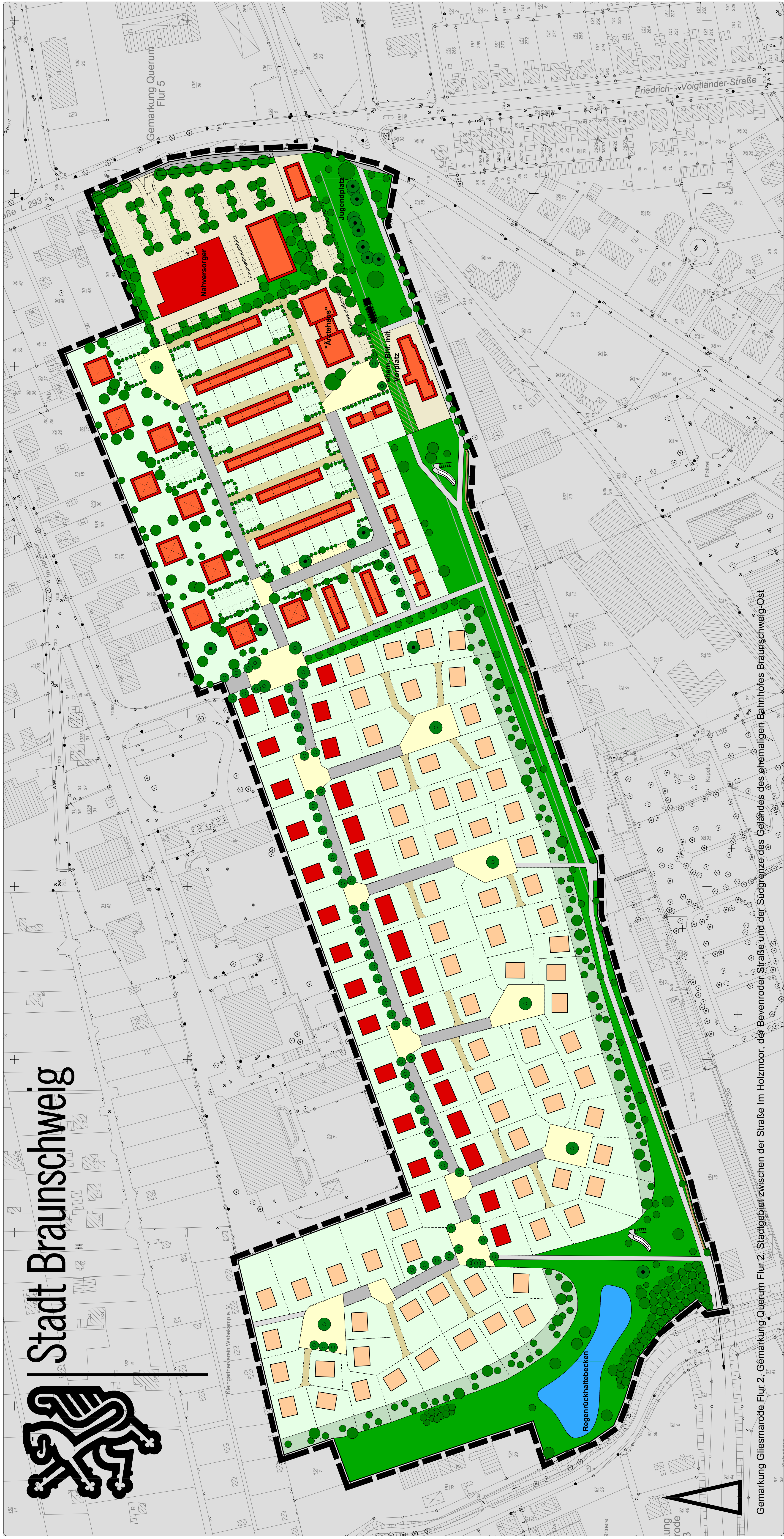
Gemarkung Glesmarode Flur 2, Gemarkung Querum Flur 2, Stadtgebiet zwischen der Straße im Holzmoor, der Bevenroder Straße und der Südgrenze des Geländes des ehemaligen Bahnhofs Braunschweig-Ost